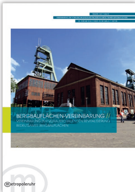
Fig. 1. Mining Area Agreement (1). Bild 1. Bergbauflächen-Vereinbarung (1).

mining company RAG Aktiengesellschaft with its real-estate subsidiary and the Ruhr Regional Association (RVR), concluded the “Mining Area Agreement | Agreement on the Forward-looking Revitalisation of Significant Mining Areas” (BBFV) (1). The BBFV (Figure 1) was concluded against the backdrop of the then pending closures of the last three mines: Auguste Victoria in Marl (2015) and Prosper-Haniel in Bottrop (2018) and in Ibbenbüren (2018). The objective was to create a long-term funding perspective for the municipalities and the landowner. The state government was supposed to communicate to the involved players that there was a common basic understanding that the subsequent use of the areas required “plenty of stamina”. The BBFV marks the start of a new cooperation process designed to ensure a successful transformation in former mining regions through the common efforts of the parties.