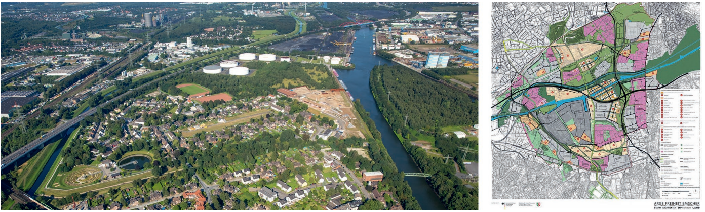
Fig. 3. Project Freiheit Emscher, Essen: aerial photograph, framework plan & Emil Emscher (5, 6). Bild 3. Freiheit Emscher, Essen: Luftbild, Rahmenplan & Emil Emscher (5, 6).

BBFV sites (Figure 3). One example is seen in the forward-looking coordination of the mine operator's final operating plan procedure with the related urban development planning, which is the responsibility of the municipality. Such processes lead to a minimisation of the use of resources as experience grows.