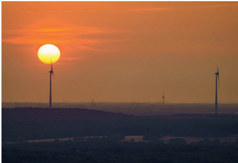
Fig. 2. Post-mining potential: During the energy transition, there are a lot of ways in which the coal industry can support the switch to renewable energies.

Bild 2. Potentiale des Nachbergbaus: Im Zuge der Energiewende kann die Kohleindustrie etliche Beiträge zur Umstellung auf erneuerbare Energien liefern.