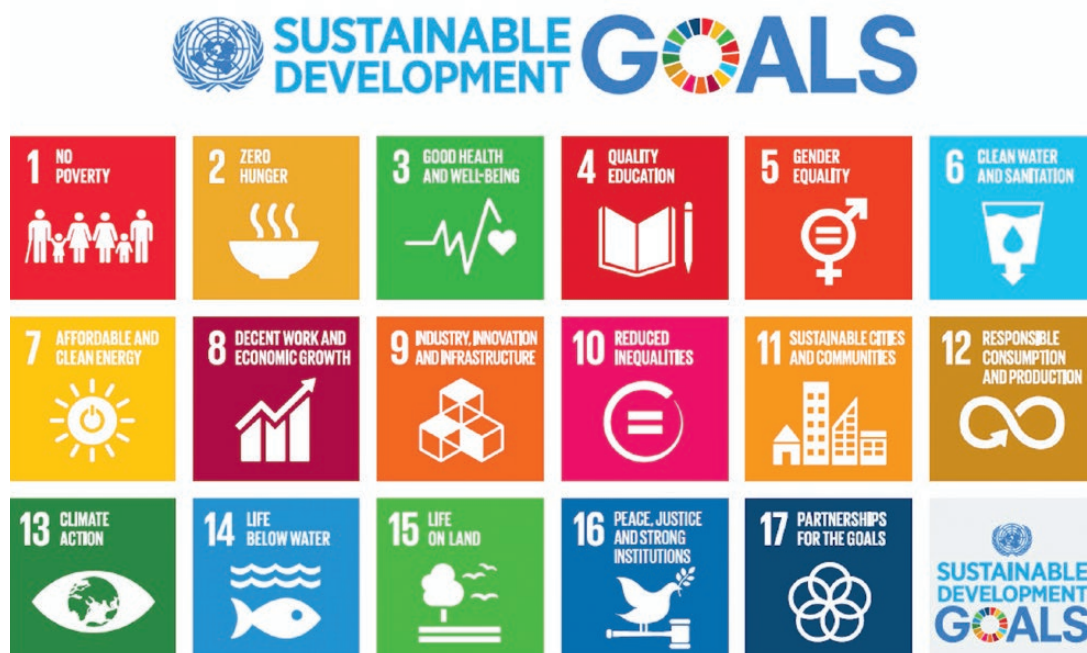
Fig. 1. UN Sustainable Development Goals. Bild 1. UN Sustainable Development Goals.

Auf Grundlage dieser Prinzipien enthalten die 2012 von den Vereinten Nationen mit dem Zielhorizont 2030 beschlossenen 17 UN Sustainability Goals u.a. das Ziel Nr. 12 „Sustainable Production and Consumption“, in dem ausdrücklich folgender Nachhaltigkeitsanspruch an den Sektor Bergbau niedergelegt worden ist (Bild 1):