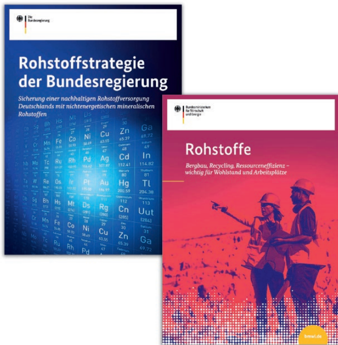
Fig. 2. Cover pages of BMWi brochures setting out the Federal Government's national resources strategy.