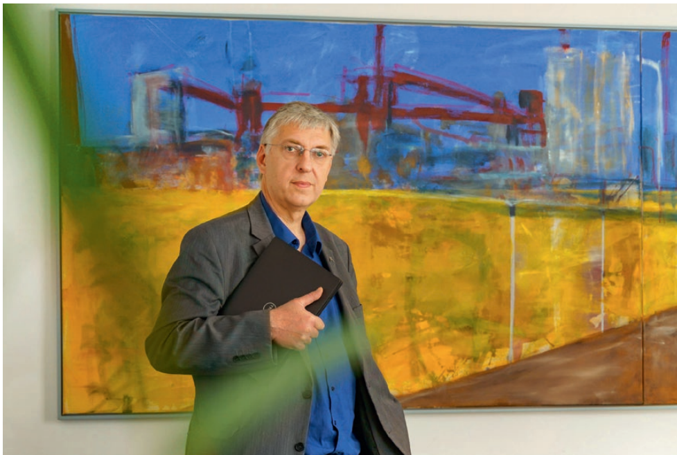
Fig. 1. Prof. Kai van de Loo researches the economic-political aspects of the post-mining era at the FZN. Bild 1. Prof. Kai van de Loo erforscht am FZN die wirtschaftspolitischen Aspekte der Nachbergbauzeit.