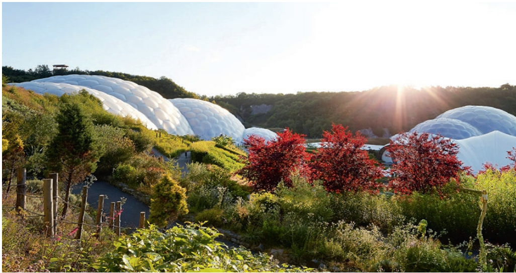
Fig. 5. The Eden Project in Cornwall/GB (20). // Bild 5. Eden Project in Cornwall/Großbritannien (20).

and yet it is one that in some cases has yielded innovative and quite astonishing solutions – though there are still quite a few gaps to be closed, these usually being case-specific and difficult to generalise.