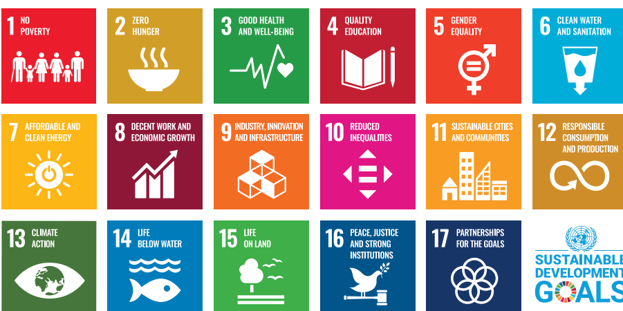
Fig. 3. The 17 Sustainable Development Goals (8). // Bild 3. Die 17 Ziele für nachhaltige Entwicklung (8).

Dass bergbauliche Prozesse und die nachhaltige Nutzung von Georessourcen alle 17 SDGs adressiert, lässt sich vor diesem Hintergrund unmittelbar nachvollziehen. Diese Feststellung ist im Sinne eines Narrativs mit konkreten Aspekten zu belegen. Dazu werden die einzelnen SDGs mit entsprechenden Aussagen verbunden. In diese Analyse sind auch