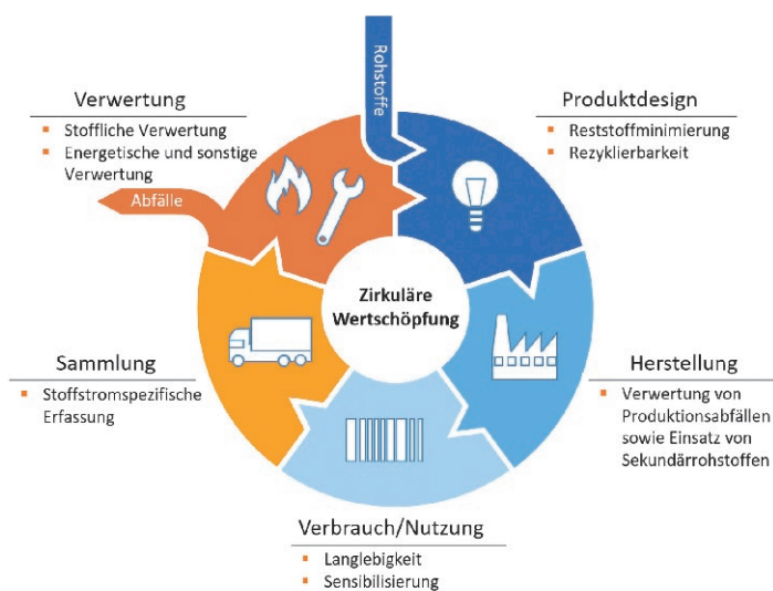
Fig. 5. Circular Economy (26). // Bild 5. Zirkuläre Wertschöpfung (26).

Der Blick auf die Argumentationen der Skeptiker des Konzepts der zirkulären Wertschöpfung offenbart aufschlussreiche Aspekte (27). So lässt sich am Beispiel des Rohstoffs Sand zeigen, dass es u.a. bei dem Produkt Beton ganz wesentlich um den Bedarf an einem „frischen“ Zuschlagstoff geht. Auch geltende technisch-sicherheitsliche Regularien sind kaum abgestimmt auf den umfassenderen Einsatz recycelter Materialien, deren Qualitätseigenschaften un zertifiziert sind. Betrachtet man das Rohstoffvorkommen Elektroschrott, so ist festzustellen, dass die Konzentrationen bestimmter Elemente in natürlichen Lagerstätten deutlich grösser sind. Tatsächlich wird das Argument der Umweltverträglichkeit des Prozesses häufig als